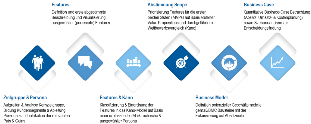
Abbildung 2: Projektvorgehen

Wie geht es nun weiter? Wir setzen an der Geschäftsmodellentwicklung an und legen den Fokus besonders auf die Generierung innovativer Einnahmequellen – nicht zuletzt auch durch die Betrachtung branchenfremder, innovativer Geschäftsmodelle und der Aufnahme neuer Impulse. In der Folge spielen wir so verschiedene Geschäftsmodell-szenarien durch, um am Ende die intelligente Vernetzung mit dem bestehenden Geschäftsmodell sicherzustellen. Konkret bedeutet das im vorliegenden Fall: Nutzung der durch die PFM App generierten Daten, Verarbeitung / Aggregation dieser, insbesondere für die Weiterentwicklung des gesamten Produktportfolios – damit Kunden höchst individualisierte Finanzprodukte & Services nutzen können ohne aufwendige manuelle Konfiguration. Wir befinden uns auf dem Endspurt – und geben nochmal Gas: Zur fundierten Entscheidungsfindung übertragen wir die qualitativen Geschäftsmodellszenarien in eine quantitative Business Case Betrachtung. Doch die Reise geht weiter, denn in unserer Rolle als inhaltlicher & organisatorischer Sparrings-Partner unterstützen wir die Retailbank noch weiter: Im Einführungsmanagement achten wir anschließend auf die konsequente Verankerung der Kundenfokussierung, Produktvision und Geschäftsmodelldefinition in allen angrenzenden Schnittstellenfunktionen (u.a. Brand-Management, Vermarktung / Kommunikation, Vertrieb). An dieser Stelle endet vorerst unsere Reise mit dem Kunden. Die digitale Transformation allerdings endet nicht, sondern startet.